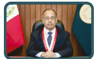
GENERAL DE BRIGADA (R) Anibal VILLAVICENCIO VILLAFUERTE FISCAL SUPREMO (T) ANTE LA VOCALÍA SUPREMA