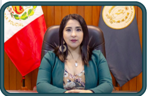
C.P.C. Zujej Florencia NIETO OMONTE INSPECTORA GENERAL DEL FUERO MILITAR POLICIAL