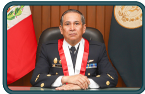
MAYOR GENERAL FAP Fernando KAHN ARCE VOCAL SUPREMO DE LA SALA SUPREMA DE GUERRA