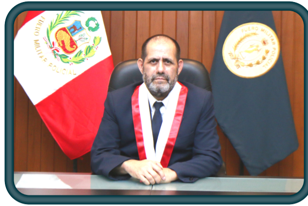
MAYOR GENERAL FAP (R) Arturo Antonio GILES FERRER PRESIDENTE DEL FUERO MILITAR POLICIAL