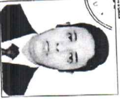
Registrador en Libro N. 2 A Trujillo, 478, agosto N. 14